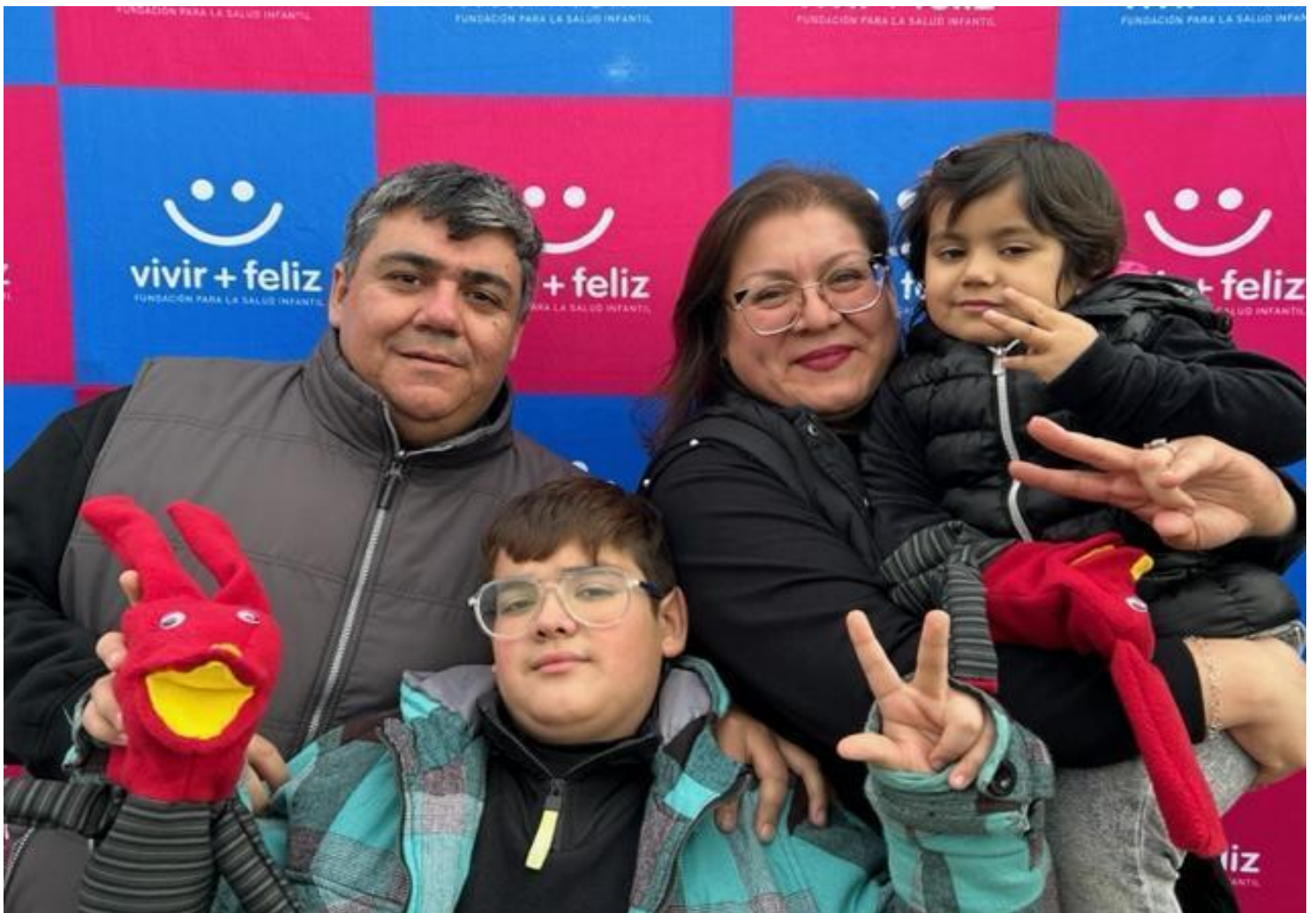
D.- Celebración día del niño en TROI Santiago - Agosto 2023